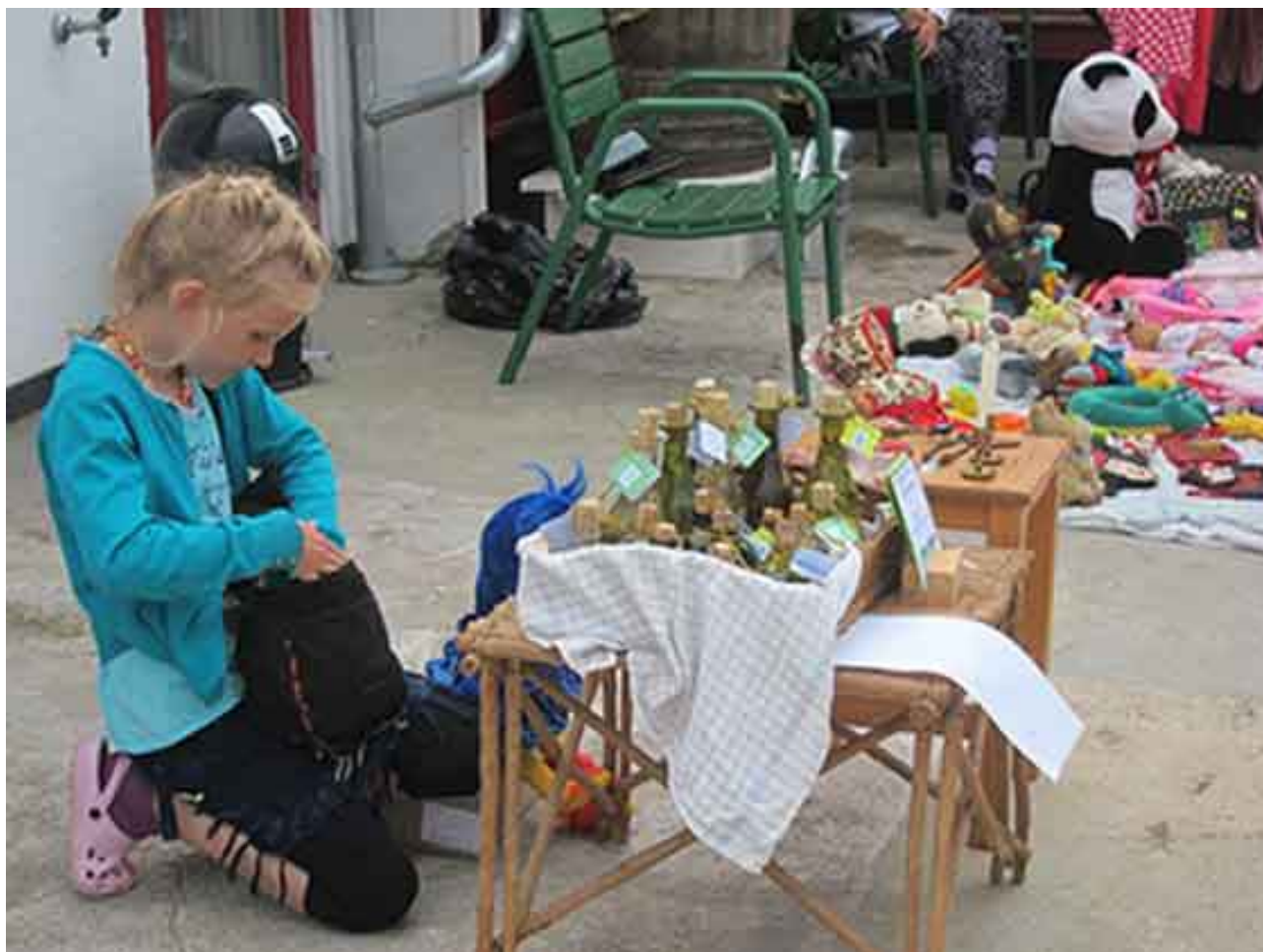
Børneloppemarked juli 2012