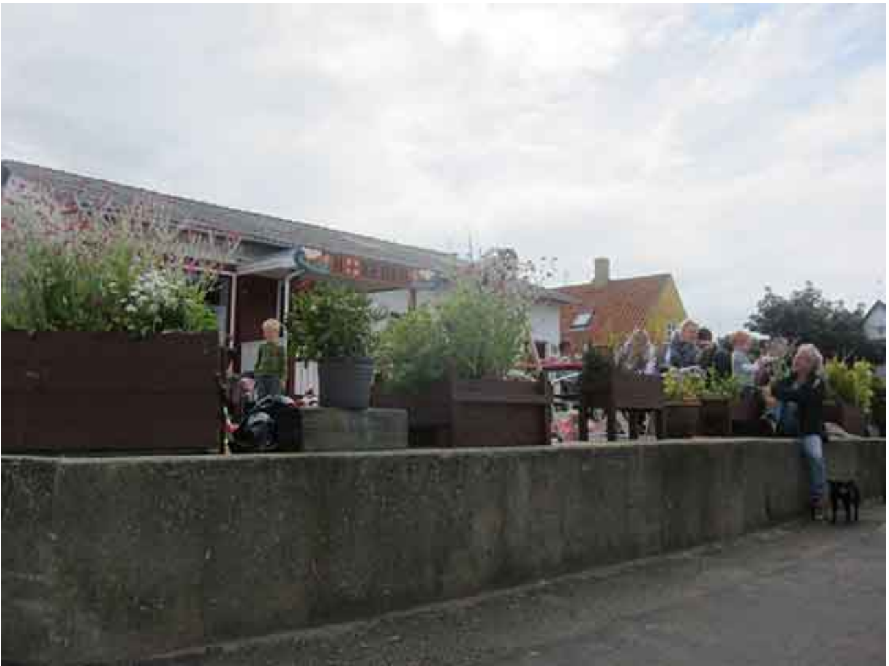
Børneloppemarked juli 2012