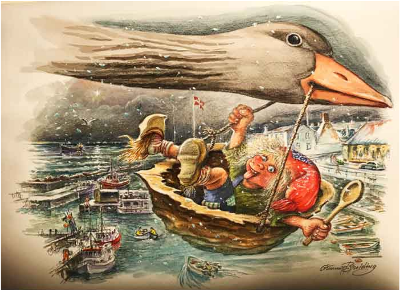
Postkort tegnet af Gunnar Breiding

Årets julekort med smukt genkendelige motiver fra Aarsdale. Kunstneren bag er den lokale tegner Gunnar Breiding.