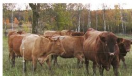
Butikken med kvalitetskød og dyrevelfærd!

At Høkeren er leveringsdygtig i det gode kød fra Mønstergaard. Der er dyrevelfærd i højsædet. Derudover har vi jo også en lang række andre bornholmske producerede kvalitetsfødevarer på hylderne som pasta, sennep, rapsolie, Svanekepølseser, mel, økomælk m.m.m.