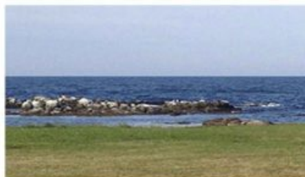
Butikken med den smukkeste udsigt!

Traditionen tro holder Høkeren åbent, når festlighederne i Parken er slut. Chancen for, at vi kan nyde et bål, der flammer mod aftenhimlen, er nok ikke så stor. Men i Høkeren vil der være åbent fra kl. 20 med frisklavet kaffe på bordet. Mulighed for at købe øl og vin og have det rart sammen i den lyse aften og nyde den smukke udsigt over havnen.